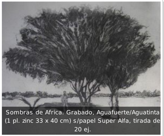
Sombras de Africa. Grabado, Aguafuerte/Aguatinta (1 pl. zinc 33 x 40 cm) s/papel Super Alfa, tirada de 20 ej.